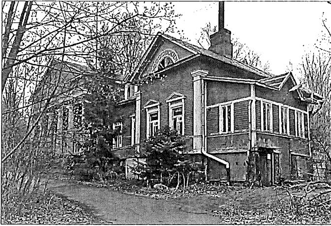
Kiiskilän kartano keväällä 2015.